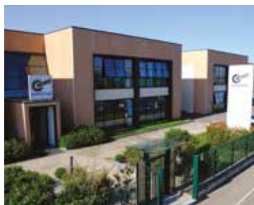
Produção de motores