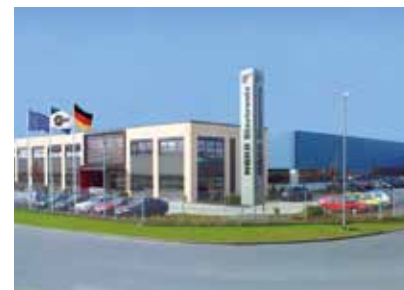
Produção de variadores de frequência

Subsidiárias e parceiros de vendas em 98 países, distribuídos sobre 5 continentes proporcionam stocks locais, montagem, fabrico, apoio técnico e atendimento ao consumidor.