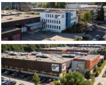
Produção de unidades de engrenagens

7 instalações de fabrico topo de gama que produzem unidades de engrenagens, motores e variadores para soluções de acionamentos completas num único local.