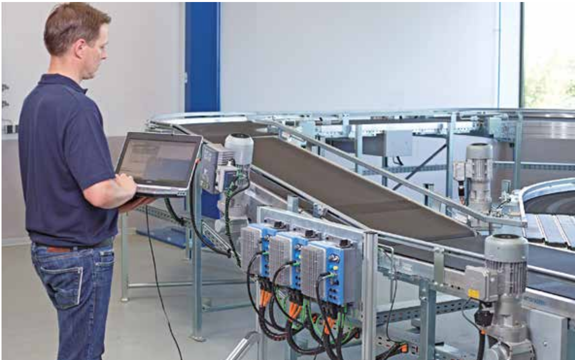
Otimização e ajuste local de produtos NORD