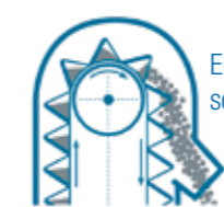
Elevatore a scarico continuo