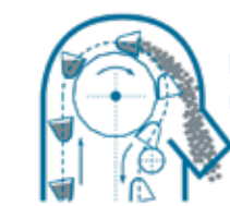
Elevatore con rullo di ricalzo