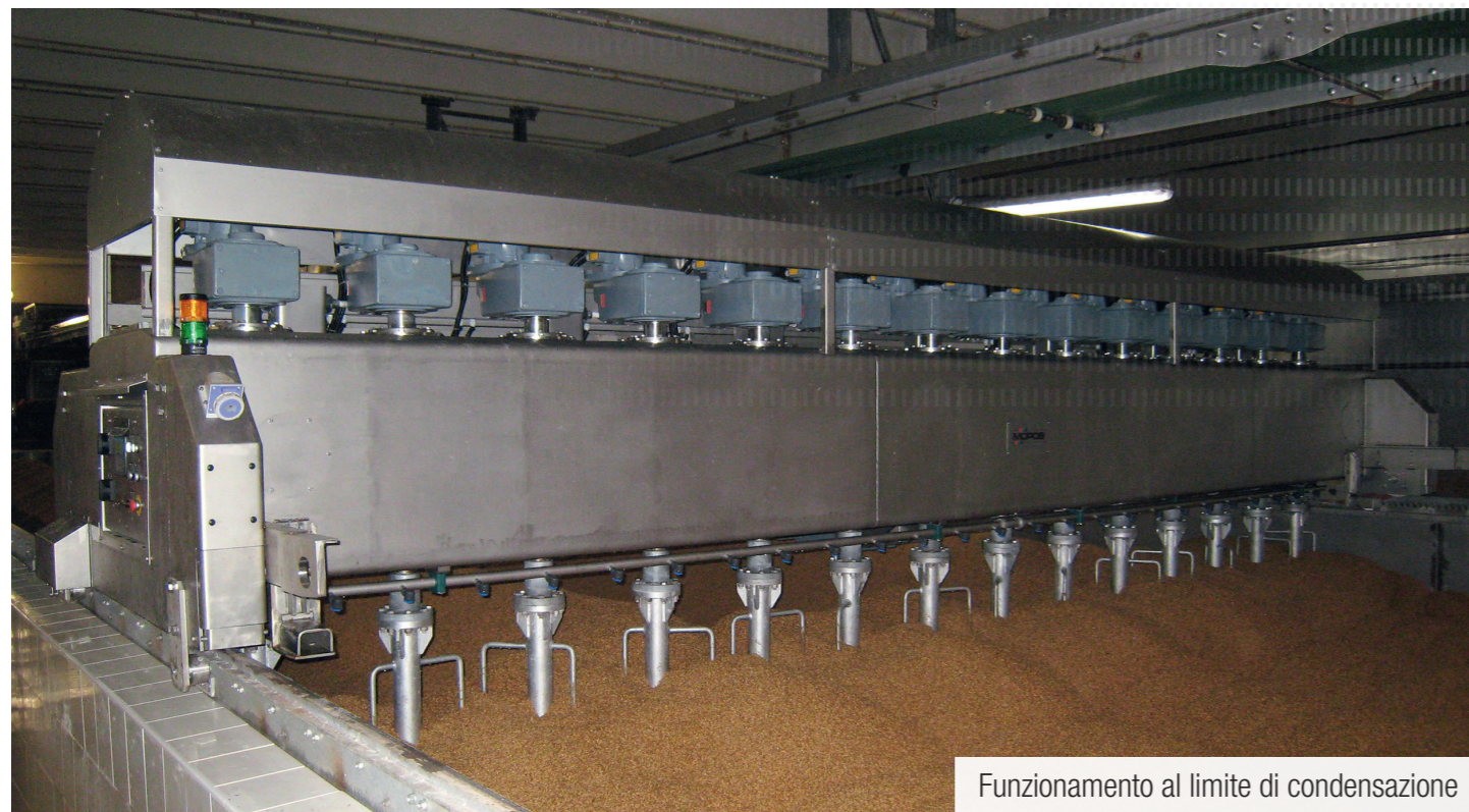
Funzionamento al limite di condensazione