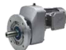
Gehäuse mit B5 Flansch, integrierter Motor