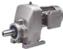
Gehäuse mit Fußbefestigung, B14 Flansch, integrierter Motor