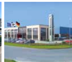
Fabricación de variadores