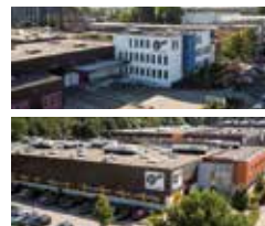
Fabricación de reductores