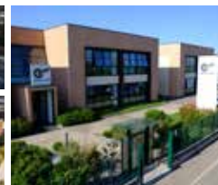
Fabricación de motores