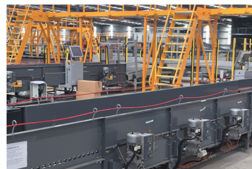
BCS-Lösung für die Toll IPEC-Anlage in Melbourne

Die NORD-Antriebselektronik: Die Motorstarter und Umrichter entwickelt und hergestellt in der firmeneigenen Elektronik-Produktionsstätte, sind sehr kompakt, erlauben eine einfache Inbetriebnahme und bieten dauerhafte Betriebssicherheit. Die breite Typen- und Optionspalette bietet einen skalierbaren Leistungsumfang für eine genaue Anpassung an Ihre Anforderungen.